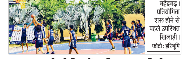
महेंद्रगढ़। प्रतियोगिता शुरू होने से पहले उपस्थित खिलाड़ी।