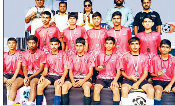
महेंद्रगढ़। खिलाड़ियों को सम्मानित करते हुए।

सीबीएसई द्वारा आयोजित नेशनल फुटबॉल टूर्नामेंट में आरपीएस सीनियर सेकेंडरी स्कूल की फुटबॉल टीम ने ब्रॉन्ज मेडल अपने नाम किया। यह प्रतियोगिता भोपाल में आयोजित की गई, जहाँ विदेशी एवं देश से विभिन्न राज्यों व क्लस्टर की श्रेष्ठ टीम भाग लेने पहुंची थी। रोमांचक मुकाबलों के बीच आरपीएस विद्यालय महेंद्रगढ़ की टीम ने अपने उत्कृष्ट खेल कौशल, अनुशासन और टीम भावना के बल पर तीसरा स्थान हासिल किया। विद्यालय के खिलाड़ियों ने न केवल विद्यालय का मान बढ़ाया, बल्कि ज़िले और प्रदेश का नाम भी राष्ट्रीय व अंतर्राष्ट्रीय स्तर पर रोशन किया। खिलाड़ियों के इस ऐतिहासिक प्रदर्शन से विद्यालय तथा क्षेत्रवासियों में हर्ष और गर्व की लहर