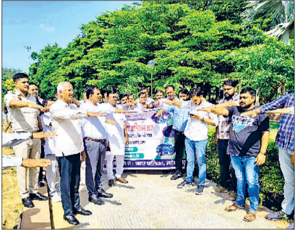
महेंद्रगढ़। स्वच्छता की शपथ लेते विधायक, डीएमसी व अन्य।

विधायक कंवर सिंह ने कहा कि स्वच्छता को स्वभाव में शामिल करना बेहद जरूरी है, तभी हम सभी मिलकर स्वच्छ पर्यावरण बनाने की दिशा में आगे बढ़ रहे हैं। आज इस पुनीत अभियान के कारण हर आमजन स्वच्छता के प्रति अपनी जिम्मेदारी निभाने के लिए उत्साहित है। मुख्यमंत्री नायब सिंह सैनी के मार्गदर्शन में प्रदेशभर में चलाए जा रहे स्वच्छ शहर अभियान के तहत आमजन को स्वच्छता की मुहूर्त से जोड़कर शहर में जागरूकता अभियान चलाए जा रहे हैं। जिला नगर आयुक्त रणवीर सिंह ने कहा कि इस कार्यक्रम के तहत शहरी क्षेत्र को स्वच्छ बनाने की दिशा में नगर