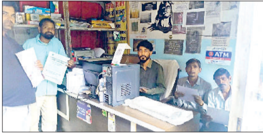
नारनौल। सीएससी सेंटर पर सरकारी योजनाओं की जानकारी लेते ग्रामीण।

को बेहतर बनाना है। वहीं इस योजना में दूसरे प्रदेश से सटे हरियाणा के जिलों को नुकसान भी होगा। योजना में यह तय किया है कि हरियाणा में जो महिला कम से कम 15 वर्ष से निवास कर रही है, उसे ही यह लाभ मिलेगा। सरल भाषा में समझे तो महेंद्रगढ़ जिला में पड़ोसी राजस्थान की विवाहिता महिला को 15 साल इंतजार करना पड़ेगा। वह इस योजना की हकदार हो सकती है। इसका नुकसान अकेले महेंद्रगढ़ ही नहीं रेवाड़ी, भिवानी, सिरसा, गुरुग्राम, बहादुरगढ़, यमुनानगर जैसे जिलों में आई दूसरे राज्य की विवाहिताओं को भी लाभ नहीं मिल पाएगा।