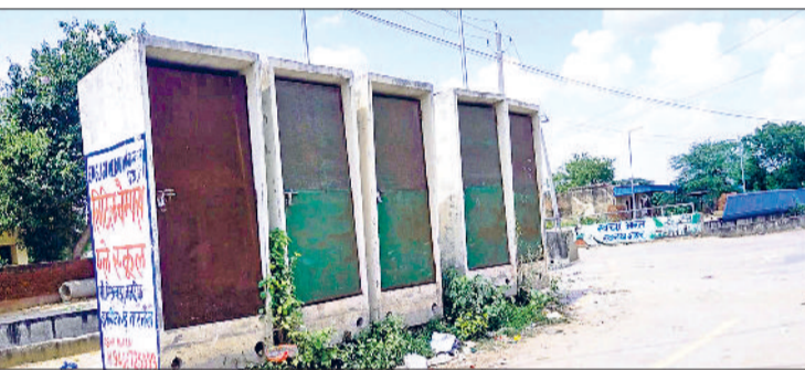
नारनौल। गंदे नाले के पास खड़े बेहाल शौचालय बूथ।

स्वच्छ भारत मिशन को सार्थक करने के लिए केंद्र सरकार ने नारा 'जहां सोच-वहां शौचालय' दिया है। नारनौल शहर की बात करें तो इस नारे के ठीक उल्टे कुछ लोग छोटी मानसिकता का परिचय देते दिखाई दे रहे हैं। 'पुरखों का चलन' का बहाना लगाकर अभी भी लोग इस पहल से किनारा कर रहे हैं। ऐसा भी नहीं है कि प्रशासन या नगर परिषद के प्रयास कम रहे हैं। शहर में पहले सर्वे करवाया गया कि कहां-कहां कितने शौचालय की जरूरत है। इसके बाद 36 सार्वजनिक शौचालय, 38 सामुदायिक शौचालय और तीन मोबाइल शौचालय स्थापित किए गए। टीबी अस्पताल, महिला कॉलेज व मालीटिबा के पास तो सात से आठ लाख रुपये प्रति