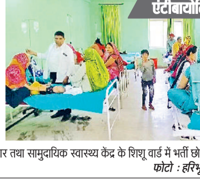
एसीबायोटिक दवाइयों से इलाज करते हैं झोलाछाप

विश्व स्वास्थ्य संगठन ने एंटीबायोटिक दवाइयों का इस्तेमाल चिकित्सकों की देखरेख में और विशेष परिस्थितियों में करने के निर्देश हैं। ऐसी दवाइयों के प्रभाव से मरीजों को तत्काल राहत तो मिलती है, लेकिन शरीर की रोगप्रतिरोधक क्षमता कमजोर होने लगती है। इधर झोलाछाप डॉक्टर एंटीबायोटिक दवाइयों इस्तेमाल करके मरीजों को तुरंत राहत देकर मोटे पैसे वसूलते हैं। ऐसी दवाइयों से किया गया इलाज मरीजों के लिए घातक साबित हो सकता है।