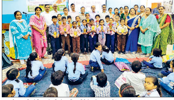
नारनौल। प्रतियोगिता के विजेता विद्यार्थियों को सम्मानित करते हुए।