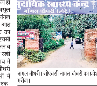
नांगल चौधरी। सीएचसी नांगल चौधरी का प्रवेश द्वार तथा सामुदायिक स्वास्थ्य केंद्र के शिशु वार्ड में भर्ती छोटे मरीज।

गांवों में झोलाछाप डॉक्टर सक्रिय हो गए, जो मरीजों से मोटी फीस वसूल रहे हैं। आपको बता दें कि नांगल चौधरी सीएचसी के अंतर्गत आठ पीएचसी तथा 25 से अधिक उप स्वास्थ्य केंद्र संचालित हैं। पीएचसी में चिकित्सकों समेत पैरामेडिकल व नर्सिंग स्टाफ की नियुक्ति कर रखी है। लेकिन संसाधनों के आभाव में अधिकतर मरीज नांगल चौधरी सीएचसी या अन्य अस्पतालों में इलाज कराते हैं। एक महीने से रुक-रुक कर लगातार बारिश हो रही है, जिसके जलभराव से आमरक्तों व मकानों के आसपास घास खड़ी हो गई है। मौसम में नमी बढ़ने से मच्छर पनपने आरंभ हो गए हैं।