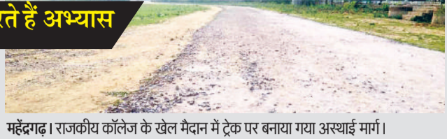
महेंद्रगढ़। राजकीय कॉलेज के खेल मैदान में ट्रैक पर बनाया गया अस्थाई मार्ग।

स्थानीय खेल स्टेडियम में सुबह-शाम भारी संख्या में खिलाड़ी अभ्यास करने के लिए आते हैं। इसके अलावा सेना में जाने वाले युवा भी इसी खेल मैदान में अभ्यास करते हैं। इसके अलावा पुलिस व सेना में जाने की इच्छुक रखने वाली युवतियां भी इसी खेल मैदान में अभ्यास करती हैं, लेकिन प्रशासन की अगदखी के कारण मजबूरी में खिलाड़ी इस ट्रैक पर दौड़ने को मजबूर हैं। खिलाड़ियों ने प्रशासन से मांग की है कि जल्द से जल्द रोड़े हटाकर कच्चा ट्रैक बनाया जाए, ताकि खिलाड़ी अभ्यास कर सकें। इस खेल स्टेडियम यहां खिलाड़ियों के पीने के पानी तक की व्यवस्था नहीं है। खिलाड़ी अपने घर से पानी लेकर स्टेडियम में आते हैं।