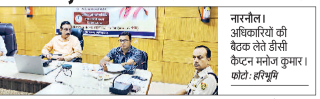
हरिभूमि न्यूज ▶ नारनौल