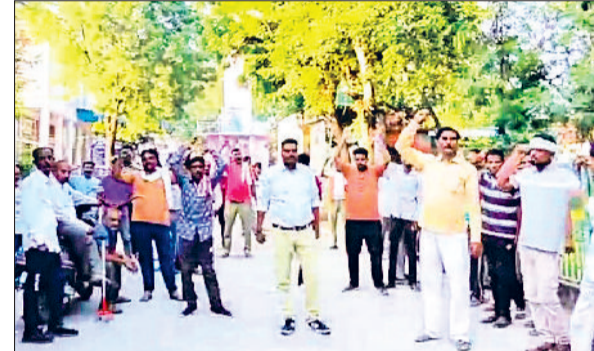
नारनौल। नारेबाजी करते सफाई कर्मचारी।