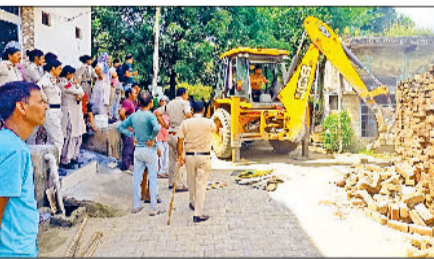
मंडी अटेली। फतनी में फिरनी पर अवैध कब्जे को हटाने हुए।